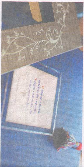
Agenda em que Ives Gandra Martins escreve os poemas

advogado Ives Gandra da Silva Martins, em SP