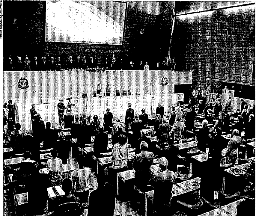
Diversas autoridades e representantes de entidades prestigiaram o evento realizado no plenário Juscelino Kubitschek

Ao longo de sua trajetória, recebeu vários prêmios: Colar de Mérito Judiciário dos tribunais de São Paulo