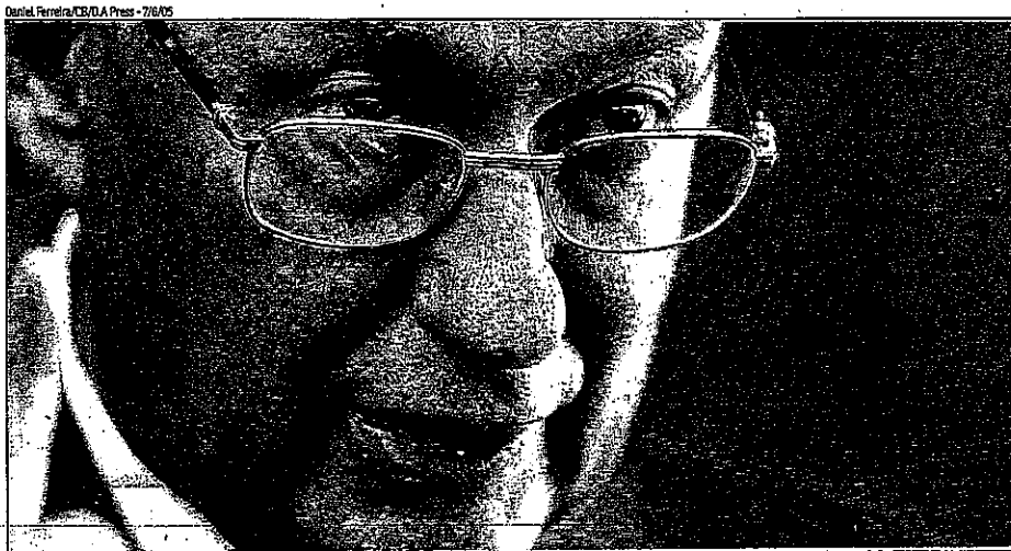
Daniel Ferreira/CEVIA Press - 7/6/05