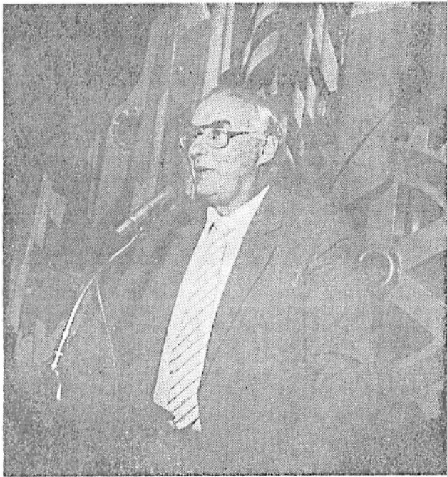
Prof. Dr. Ives Gandra da Silva Martins, no momento que proferia sua palestra sobre "Princípios da Ordem Econômica da Atual Constituição".