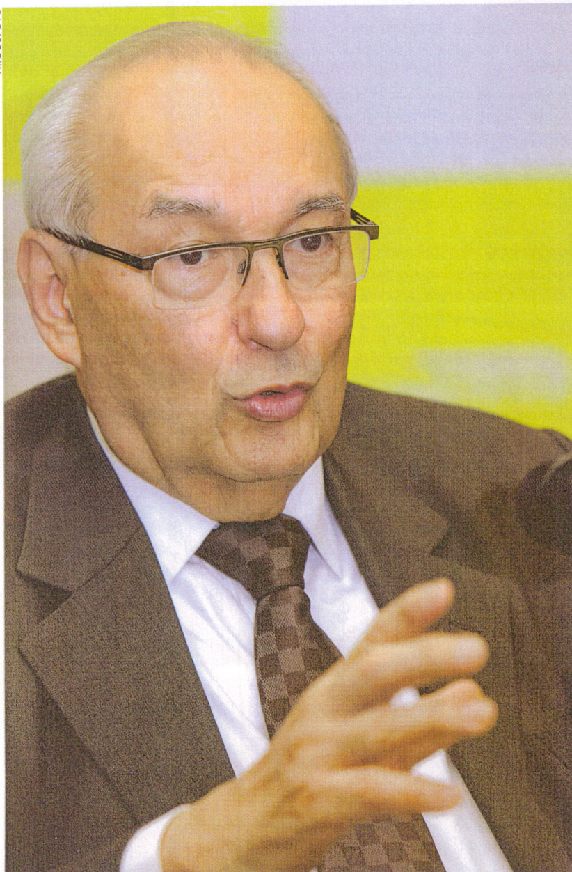
Ives Gandra: um renomado jurista brasileiro

A fala mansa, que revela serenidade e sabedoria, também reflete o homem simples que coleciona conquistas magistrais no Direito, na Literatura e, quem imaginaria, no esporte. Na vida e na arte. No ofício e na poesia. Aos 78 anos, ainda advoga com entusiasmo e defende com fervor causas nobres como ética e honestidade. O resultado é a rima perfeita entre liberdade e independência. E felicidade. “Só trabalho com o que e com quem eu acredito.” Assim é Ives Gandra Martins.