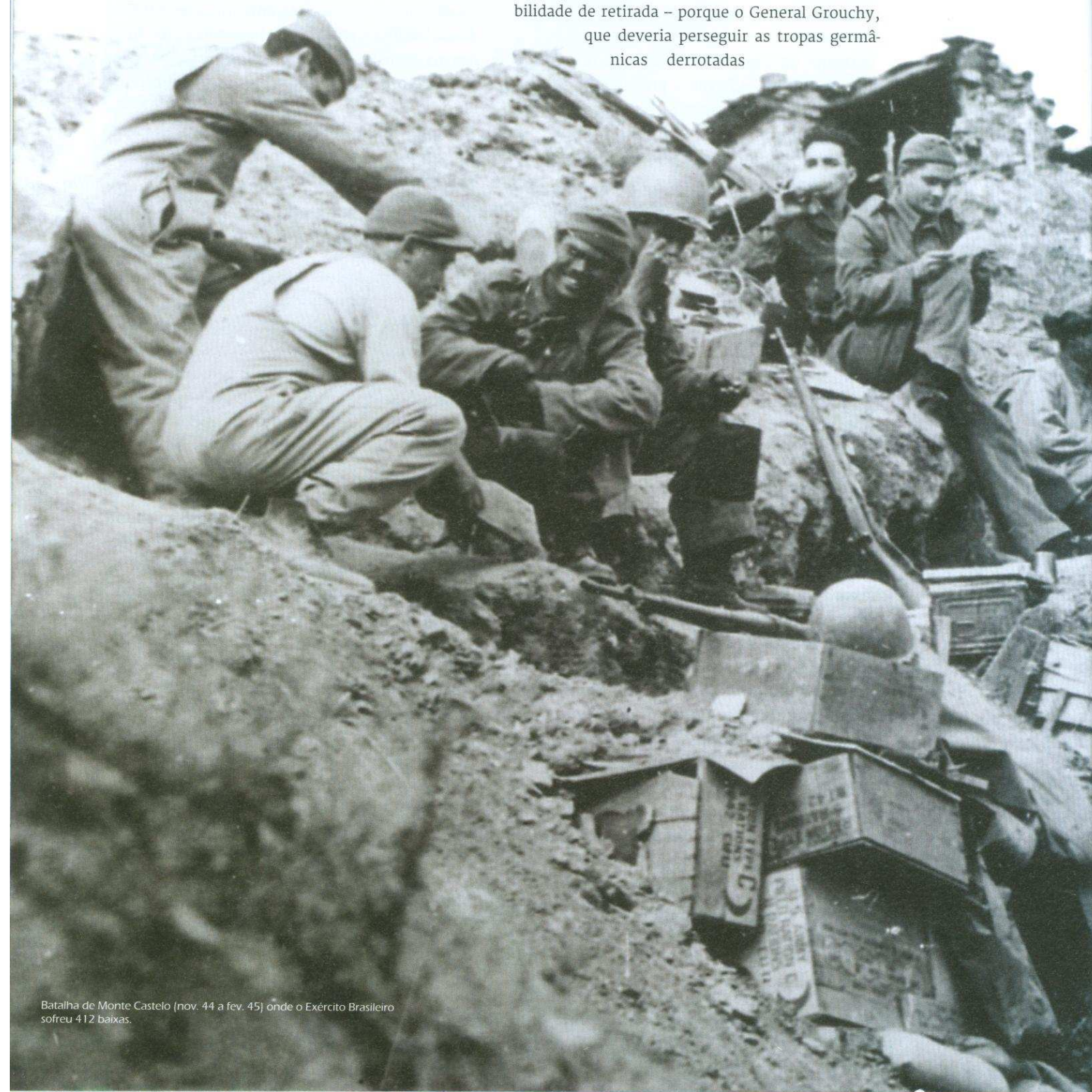
Batalha de Monte Castelo (nov. 44 a fev. 45) onde o Exército Brasileiro sofreu 412 baixas.

É de se lembrar que Napoleão apenas perdeu a batalha de Waterloo – que já tinha ganho, encurralando Wellington contra morros, sem possibilidade de retirada – porque o General Grouchy, que deveria perseguir as tropas germânicas derrotadas