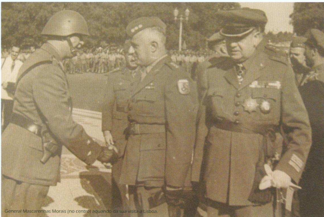
General Mascarenhas Moraes (no centro) aquando da sua visita a Lisboa.

Este artigo foi escrito em português do Brasil