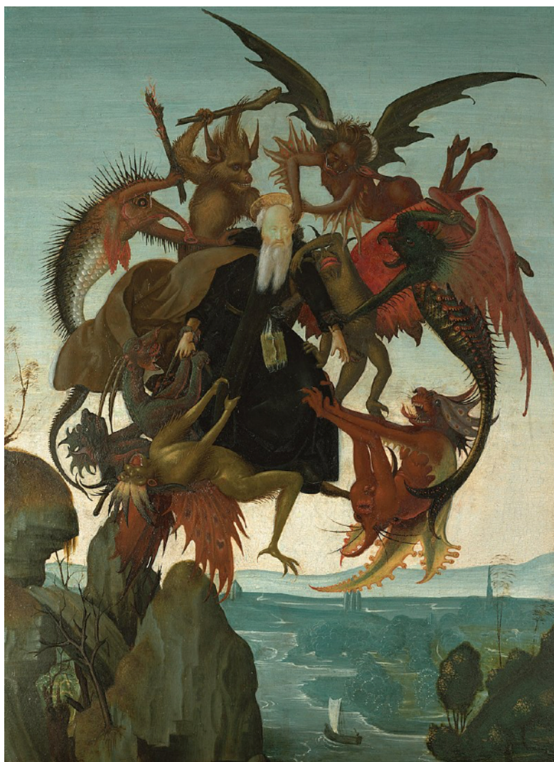
O tormento de Santo Antão, Michelangelo.

Ao final, consta na hagiografia, Santo Antão sobrevive aos demônios, e se restabelece por milagre divino, e também com a ajuda de seus amigos. Vários monges seguiram o seu estilo de vida eremita e obtiveram a vantagem de estabelecer uma conexão benéfica com a realidade e com os interlocutores. “O número de monges foi crescendo, mas o interessante é que, quando iam se aconselhar com ele, chegavam naquele lugar vários monges e perguntavam: “Onde está Antão?”. E lhes respondiam: “Ande por aí e veja a pessoa mais alegre, mais sorridente, mais espontânea; esse é Antão”.